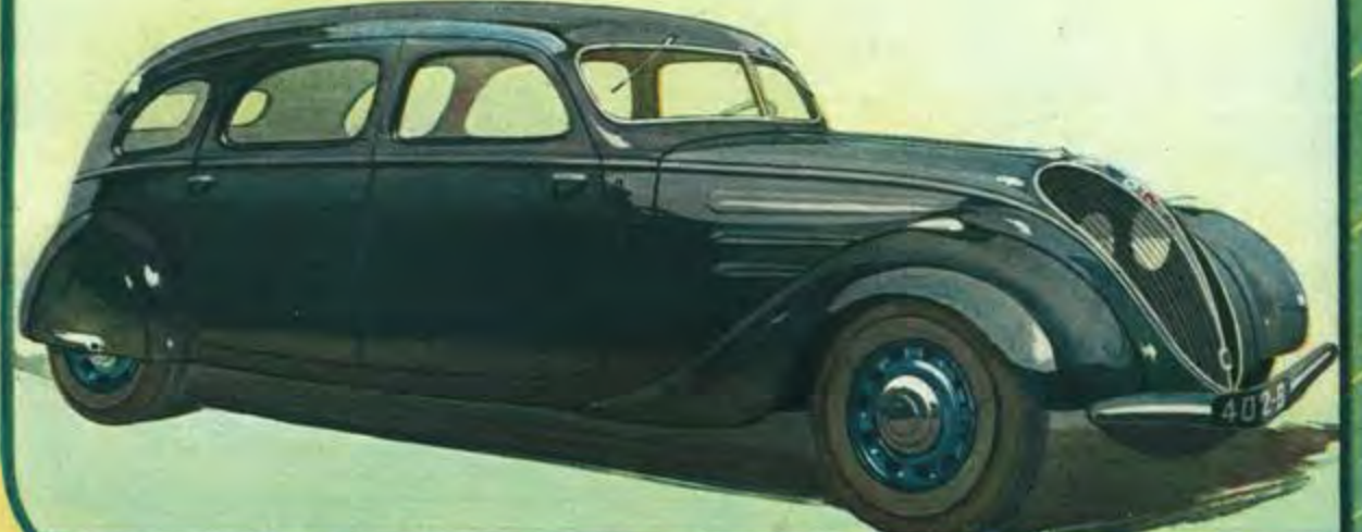
LIMOUSINE COMMERCIALE 6-8 PLACES 500 KG .. 402 B " (C.5) Carrosserie entièrement métallique. - Garnitures intérieures simili beige. - Banquette AV 3 places réglable. - Banquette AR 3 places amovible. - Aération assurée par 2 ventilateurs d'avant. - Store de lunette AR. - Pare-soleil. - Supports spéciaux sur pavillon pour fixation d'un porte-bagages. - Pare-chocs AV et AR. - Lanternes chromées sur ailes AV. 2 avertisseurs ville et route avec inverseur. - Essuie-glace 2 balais à fonctionnement symétrique et arrêt automatique. - Prise de courant sous capot pour balladeuse. - A l'AR large ouverture en 2 parties (largeur 1 m. 05, hauteur 0 m. 95), celle du haut se relevant, celle du bas pouvant se mettre en fourrage. - Longueur (ou plancher) de la banquette AV ou hayon fermé 2 m. 350. - Même cote jusqu'à l'extrémité du hayon ouvert 2 m. 10. - Largeur maximum intérieure 1 m. 42. - Hauteur intérieure 1 m. 23. - Couleurs au choix: noir ou gris.