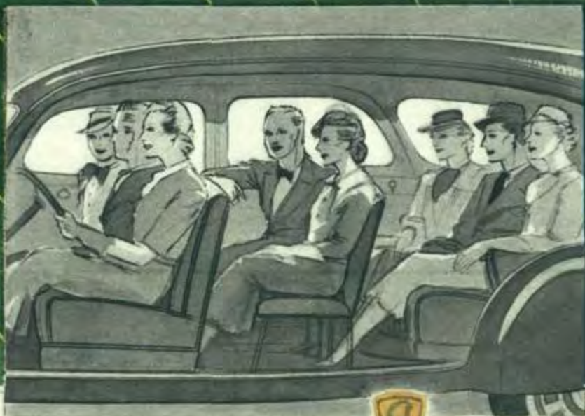
Dans la Limousine familiale 402 B, huit personnes sont confortablement assises face à la route. Le nouveau coffre AR en saillie est très spacieux.