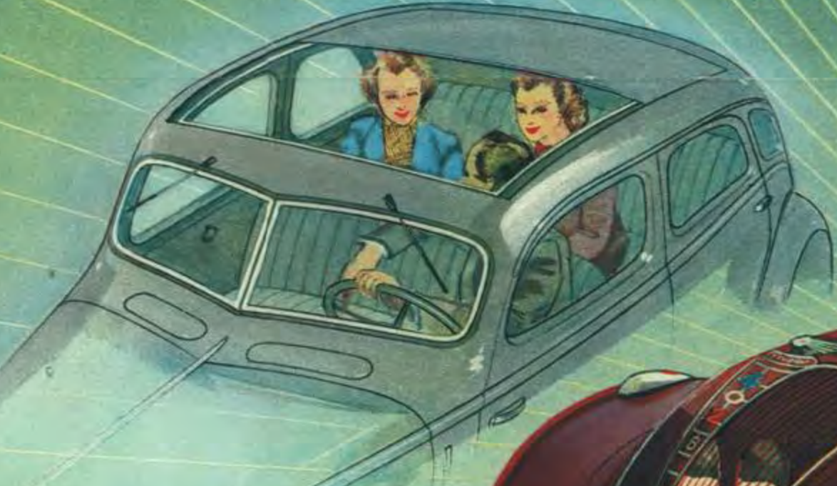
Le toit ouvrant est livré sans supplément avec toutes les limousines grand tourisme 402 B.