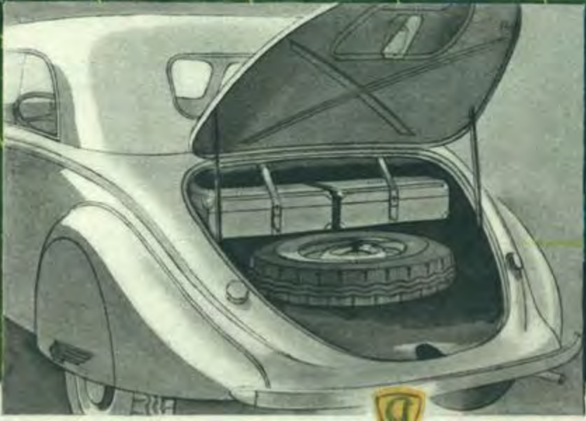
Dans le Coach 402 B, la couverture du spider donne accès au grand coffre où sont placés la roue de secours et les valises.