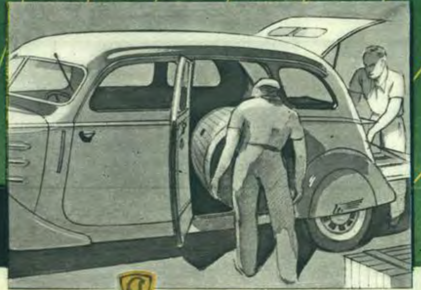
La Commerciale 402 B 500 Kg. peut recevoir: 2 pièces de vin, ou 18 paniers de 15 bouteilles ou 5 sacs de farine, ou 2 fûts et bennes de 200 litres, ou un brancard d'infirmerie, etc.