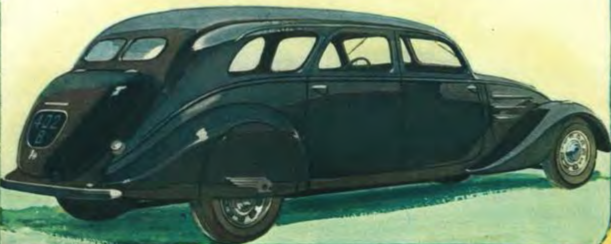
LIMOUSINE FAMILIALE 402 B GRAND LUXE 8 PLACES FACE ROUTE SUR CHASSIS LONG (F.5) Carrosserie entièrement métallique 4 portes. - Garnitures intérieures drap côtelé. - Banquette AV 3 places réglable du siège du conducteur et comportant une barre porte-couverture chromée. - Banquette AR 3 places et 2 strapontins face route, à dossier. - Empattement très spacieux pour 8 passagers. - Aération assurée par 2 ventilateurs d'avant et par ventilateur électrique diffusant à volonté de l'air pur, chaud ou froid. - Dégivreur de pare-brise. - Store de lunette AR commandé à distance. Fillet chapelet. - 2 pare-soleil. - Accoudoir central à l'AV et à l'AR. - Supports spéciaux sur pavillon pour fixation d'un porte-bagages. - Pare-chocs AV et AR. - Lanternes chromées sur ailes AV. - 2 avertisseurs ville et route avec inverseur. - Essuie-glace électrique 2 balais à fonctionnement symétrique et arrêt automatique. - Prise de courant sous capot pour balladeuse. - Indicateurs de direction électriques et encastrés. - Montre. Compteur bi-totalisateur. - 3 couleurs au choix: noir, rouge, gris.