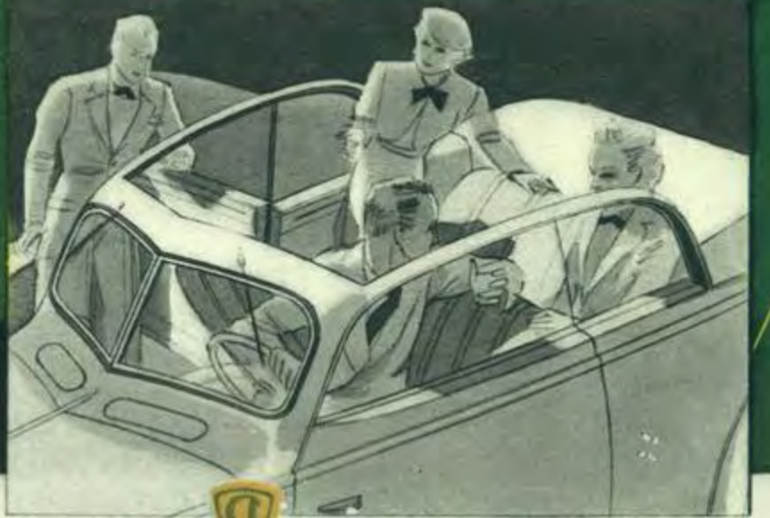
Dans le Coach décapotable 402 B, le système articulé est d'une manœuvre aisée. Il assure une excellente herméticité en s'appuyant sur le pourtour de la carrosserie.

L A 402 B possède un brio incomparable grâce au rendement "record" du nouveau moteur 402 B dont on a lu par ailleurs