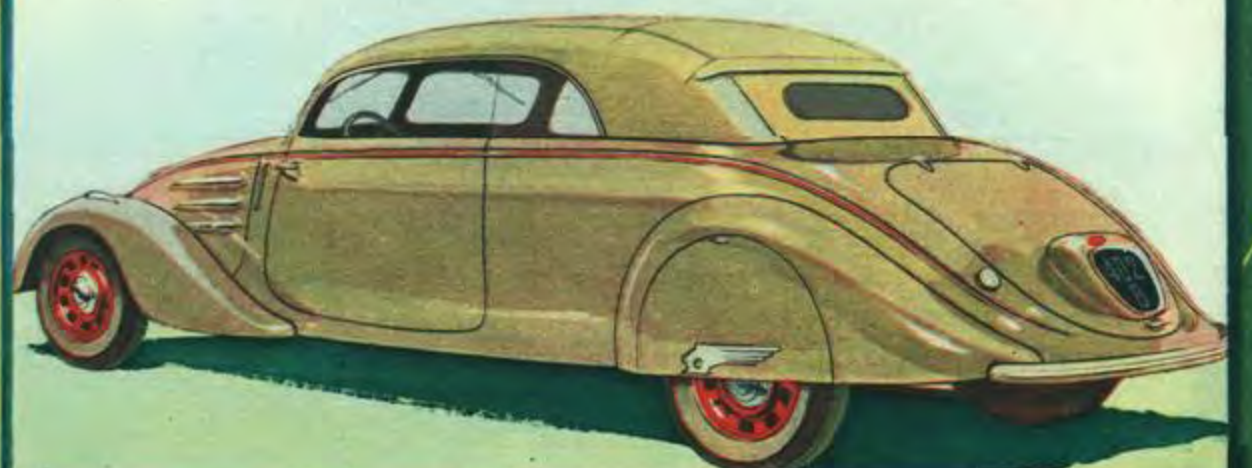
COACH DÉCAPOTABLE à PLACES .. 402 B " (D.5) Carrosserie entièrement métallique 2 portes. - Garnitures des sièges en cuir de premier choix. - Sièges AV séparés et jointifs, réglables garnis de Dunlopillo. - Banquette AR 3 places. - Aération assurée par 2 ventilateurs électriques diffusant à volonté de l'air pur, chaud ou froid. - Dégivreur de pare-brise. - 2 pare-soleil rhodod. - Accoudoirs centraux et latéraux à l'AV et à l'AR. - Cendriers dans les accoudoirs latéraux AR. - Pare-chocs AV en acier chromé. Pare-chocs AR en caoutchouc moulé avec embouts chromés. - Lanternes AV chromées. - 2 avertisseurs ville et route avec inverseur. - Prise de courant sous capot pour balladeuse. - Essuie-glace électrique avec 2 balais à fonctionnement symétrique et arrêt automatique. - Indicateurs de direction électriques et encastrés. - Montre. Compteur bi-totalisateur. - 2 mallettes dans le coffre AR. - Capote en whipcord. - Nombreuses teintes de carrosserie.