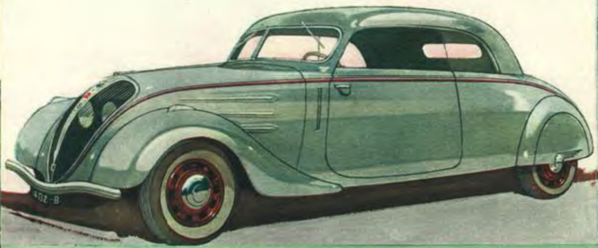
COACH à PLACES .. 402 B " (W.3) Carrosserie entièrement métallique 2 portes. - Garnitures intérieures drap. - Sièges AV séparés et jointifs, réglables et garnis de Dunlopillo. - Banquette AR 3 places garnie de Dunlopillo. - Aération assurée par 2 ventilateurs électriques diffusant à volonté de l'air pur, chaud ou froid. - Dégivreur de pare-brise. - Store de lunette AR commandé à distance. Fillet chapelet. - 2 pare-soleil rhodod. - Accoudoirs centraux et latéraux à l'AV et à l'AR. - Cendriers dans les accoudoirs latéraux AR. - Supports spéciaux sur pavillon pour fixation d'un porte-bagages. - Pare-chocs AV en acier chromé. - Pare-chocs AR en caoutchouc moulé avec embouts chromés. - Lanternes AV chromées. 2 avertisseurs ville et route avec inverseur. - Prise de courant sous capot pour balladeuse. - Essuie-glace électrique 2 balais à fonctionnement symétrique et arrêt automatique. - Indicateurs de direction électriques et encastrés. - Montre. Compteur bi-totalisateur. - 2 mallettes dans le coffre AR. - Nombreuses teintes de carrosserie.